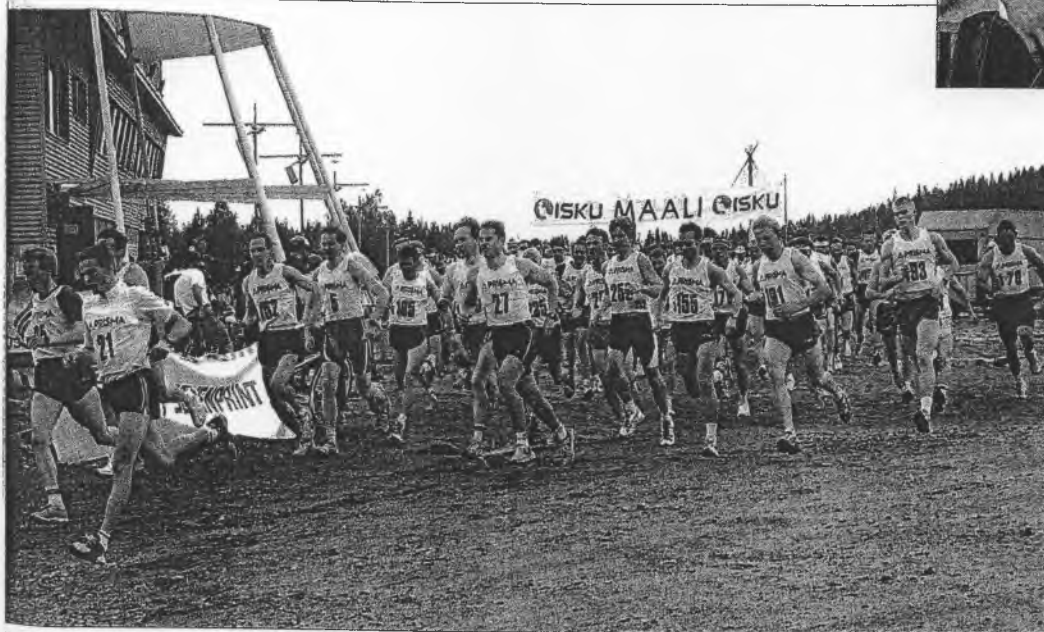
■ Joulupukin maratonin eri matkoille sääntäsi noin 170 juoksijaa. Kilpailukeskuksena palveli ensi kertaa Ounasvaaran uusittu hiihtostadion.