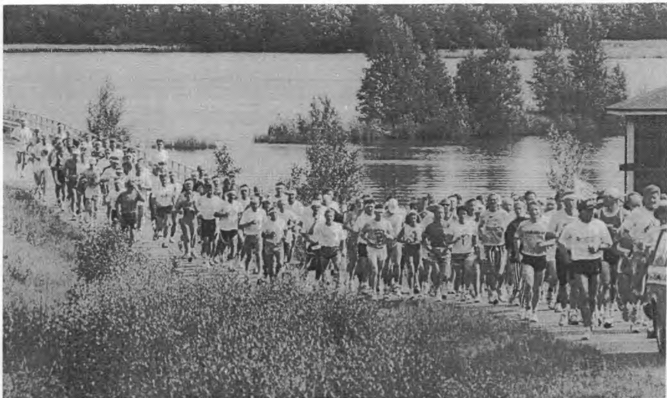
Suomi juoksee-viesti eteni Alakorkalon maisemissa ennalta määrättyä vauhtiaan eli runsaat viisi kilometriä tunnissa.